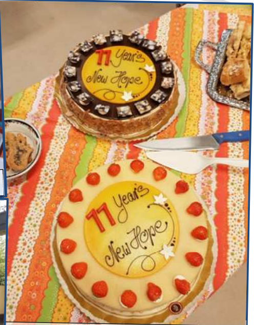
11 Jahre New Hope