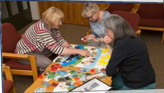
Gemeindefreizeit in Kaub am Rhein