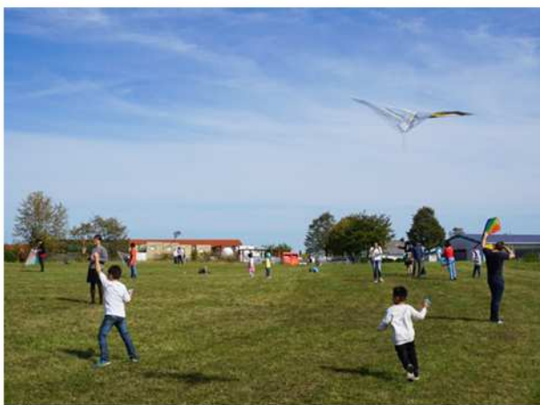
Drachentag 2019