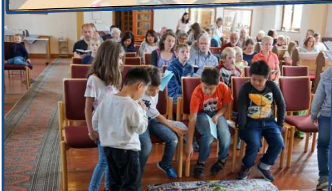
Drachentag in Weitefeld