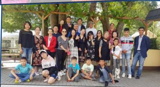
Besuch von Tin Lanh in Böblingen